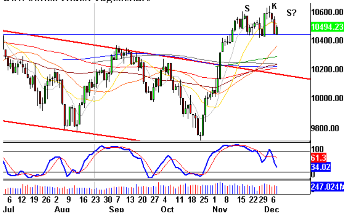
Dow Jones Index Tageschart

Die Bildung der linken Schulter hat 13 Tage gedauert. Geht man von einer symmetrischen Formation aus, so würde sich die rechte Schulter in der letzten Dezember-Woche ausgebildet haben.