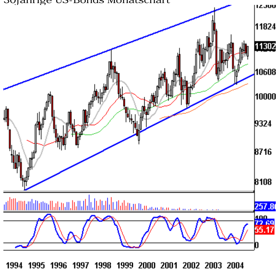
30jährige US-Bonds Monatschart

Im folgenden Wochenchart lässt sich erkennen, dass die 30jährigen nach dem Bruch der Abwärtstrendlinie (gelb) diese lediglich noch einmal getestet haben, bevor sie ihre Aufwärtsbewegung fortsetzten. Geholfen hat dabei, dass das 50%-Retracement der letzten größeren Aufwärtsbewegung ebenfalls als Unterstützung diente.