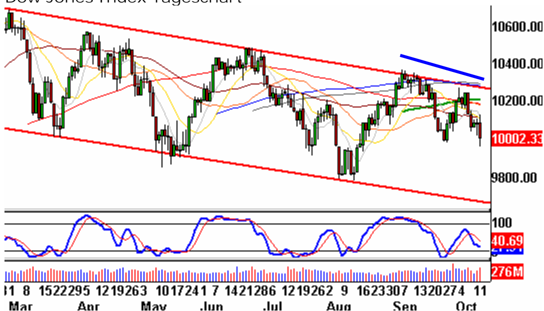
Dow Jones Index Tageschart

Doch die jüngste Korrektur macht einen Unterschied. Damals dauerte sie zwei Tage. Gestern ist im aktuellen Chart das Tief vom Freitag unterschritten worden. Damit kann von einer Zwei-Tages-Korrektur nicht mehr die Rede sein: Fünf Abwärtstage müssen jetzt registriert werden.