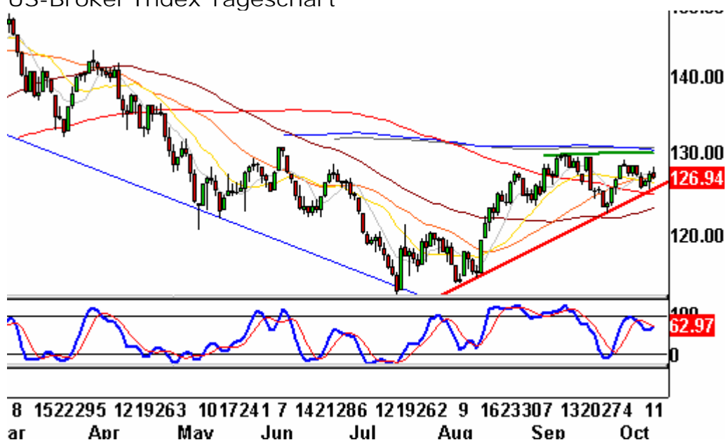
US-Broker Index Tageschart

----- Ein Chart, der noch verhältnismäßig bullisch erscheint, ist der bereits gestern gezeigte Broker-Index. Eine Entscheidung zwischen der Überwindung des 200-Tages-Durchschnitts bei 130 Punkten und dem Bruch der roten Aufwärtstrendlinie steht bevor.