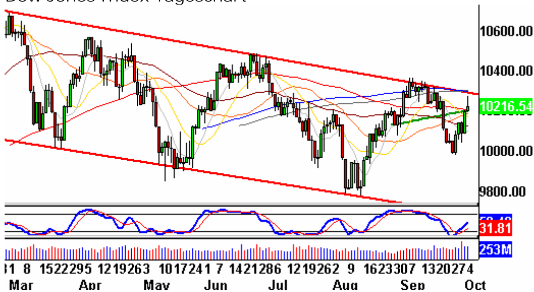
Dow Jones Index Tageschart

Auf dem Chart von 1934 lässt sich erkennen, dass der Dow auch damals einige Tage unterhalb seiner Abwärtstrendlinie konsolidierte, bevor er den Ausbruch wagte.