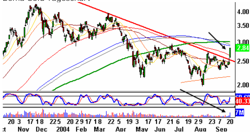
Bema Gold Tageschart

Von den etwa 600 bedeutenden Wendepunkten, die für den Dow Jones Index seit 1900 notiert werden können, befinden sich 61 im Oktober; kein anderer Monat weist so viele Wendepunkte auf. Teilt man die 61 in Tiefs und Hochs auf, so zählt man 38 Tiefs und 23 Hochs. Die Wahrscheinlichkeit, dass ein Wendepunkt im Oktober ein Tief ist, ist demnach recht groß, allerdings nicht überragend.