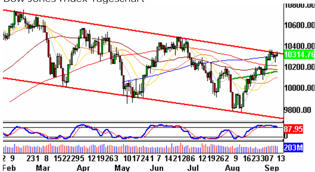
Dow Jones Index Tageschart

Wir tippen auf eine Abwärtsbewegung, wissen aber auch, dass ein Ausbruch aus der Handelsspanne Richtung Norden bullische Implikationen hätte. Unser Stopp ist eng gesetzt.