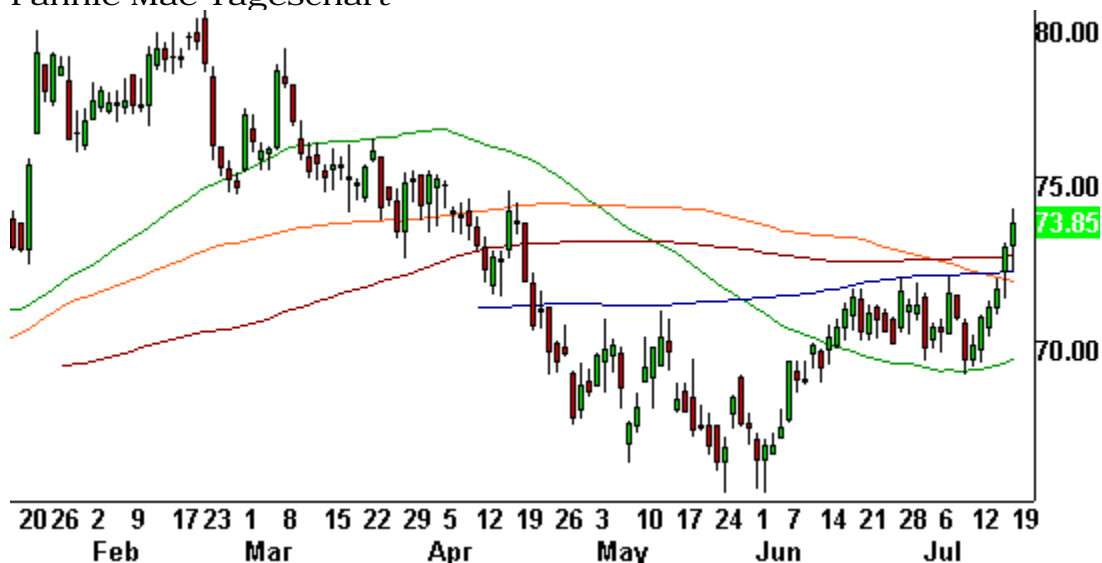
Fannie Mae Tageschart

Die Zinsen scheinen das Finanzierungsgeschäft im Immobilienbereich nicht zu gefährden. Dies zumindest deutet der Chart von Fannie Mae an. Jeder der vergangenen sechs Tage war ein Aufwärtstag; die Phase der Bodenbildung scheint dem Ende entgegenzugehen.