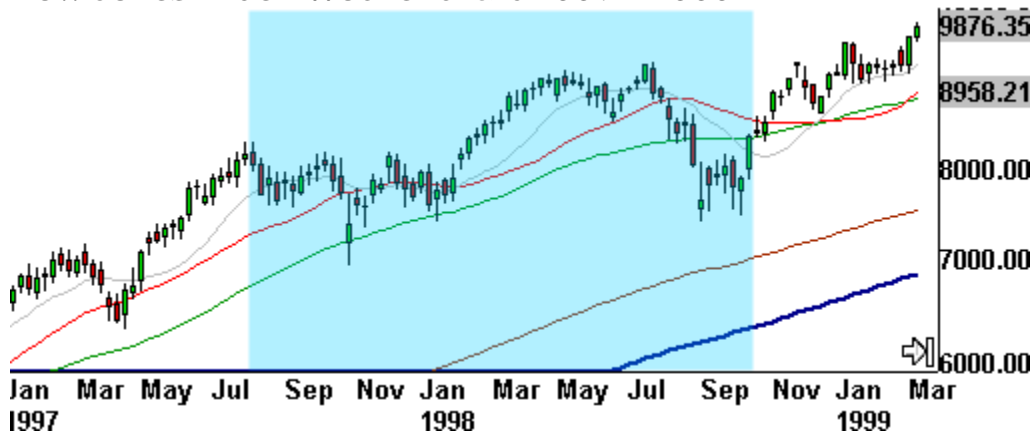
Dow Jones Index Wochenchart 1997 - 1999

Während der Halbleiter-Index bereits im Sommer 1997 seinen Zenit erreichte und anschließend bis zum Herbst 1998 ständig tiefere Hochs markierte, jagte der Dow in dieser Zeit von einem neuen Hoch zum andern. Der Dow toppte erst im Sommer 1998 aus; ein volles Jahr nach den Halbleitern.