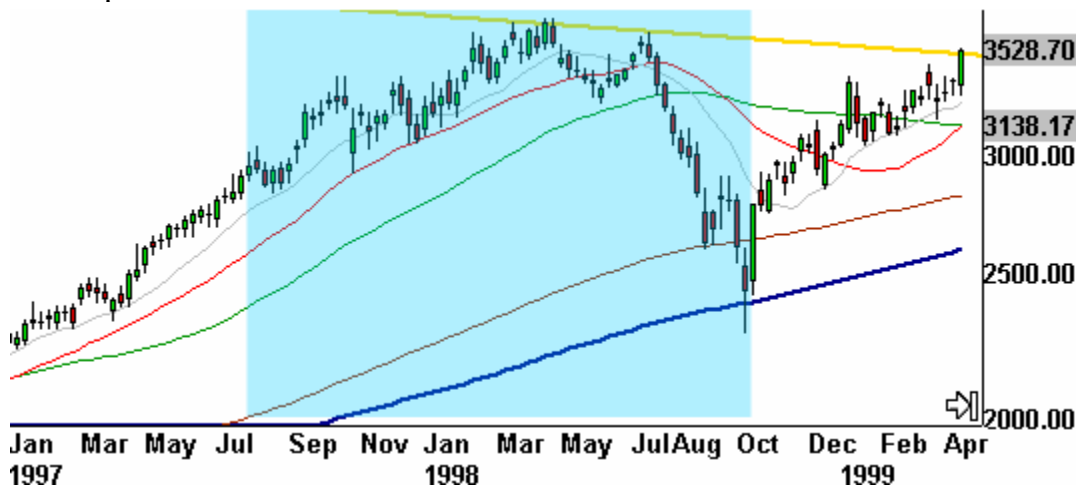
Transport-Index Wochenchart 1997-1999

Es sieht danach aus, als ob wir gegenwärtig eine ähnliche Situation erleben. Die Schwäche der Halbleiter wird von Dow, S&P500 und dem Transport-Index nicht geteilt. Und wir aus dem obigen Beispiel gelernt haben, kann dies eine ganze Weile so bleiben. Diesmal vielleicht nicht ein ganzes Jahr, aber doch einige Monate.