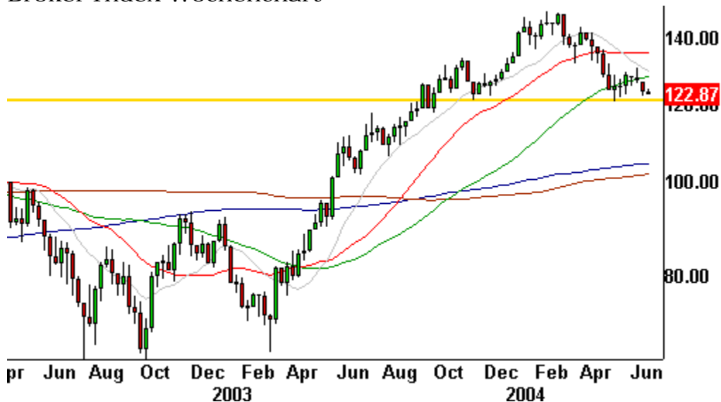
Broker Index Wochenchart

Der Broker-Index (darin enthalten sind z.B. Morgan Stanley und Goldman Sachs) ist für die Entwicklung des Gesamtmarktes von erheblicher Bedeutung. Es ist nicht zu leugnen, dass der Chart zu wünschen übrig lässt. Noch ist die potentielle Nackenlinie nicht durchbrochen; doch die Gefahr der Ausbildung einer SKS-Formation besteht.