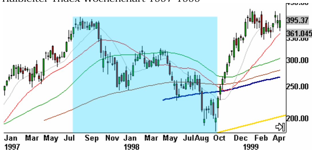
Halbleiter-Index Wochenchart 1997-1999

Während der Halbleiter-Index bereits im Sommer 1997 seinen Zenit erreichte und anschließend bis zum Herbst 1998 ständig tiefere Hochs markierte, jagte der Dow in dieser Zeit von einem neuen Hoch zum andern. Der Dow toppte erst im Sommer 1998 aus; ein volles Jahr nach den Halbleitern.