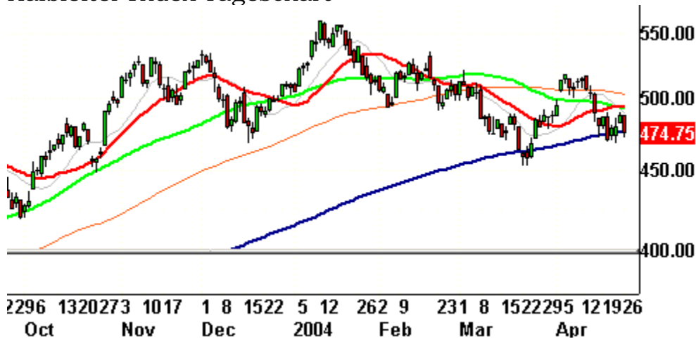
Halbleiter Index Tageschart

----- Gestern erreichte die Zahl der neuen Tiefs an der NYSE ein neues 52-Wochen-Hoch. Dies wird durch den ebenfalls stark steigenden 10-Tages-Durchschnitt auf dem folgenden Chart reflektiert.