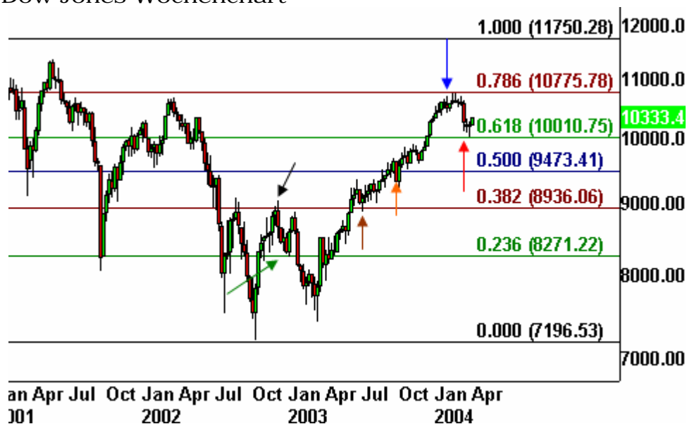
Dow Jones Wochenchart

Im September wurde die 50% Marke umkämpft (oranger Pfeil) und letztendlich überwunden. Die 61% Marke wurde glatt durchstoßen; der Kurs des Dow schnellte bis zur 78,6% Marke hoch (blauer Pfeil), wo er kehrte und auf die 61,8% Marke zurückfiel. Diese wurde vor kurzem - zunächst erfolgreich - getestet (roter Pfeil).