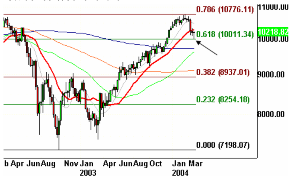
Dow Jones Wochenchart

Zur freitäglichen Chart-Übersicht. In der letzten Woche stand hier zum Dow zu lesen: „Die Unterstützung durch den 20-Wochen-Durchschnitt (rote Linie) zeigt Wirkung. Ob der Test erfolgreich verläuft, ist noch nicht absehbar. Betrachtet man die Bewegungen des Dow in der Vergangenheit (siehe vergangene Wellenreiter), so ist davon auszugehen, dass mindestens eine schwache, zwei bis dreiwöchige Aufwärtsbewegung folgt.“