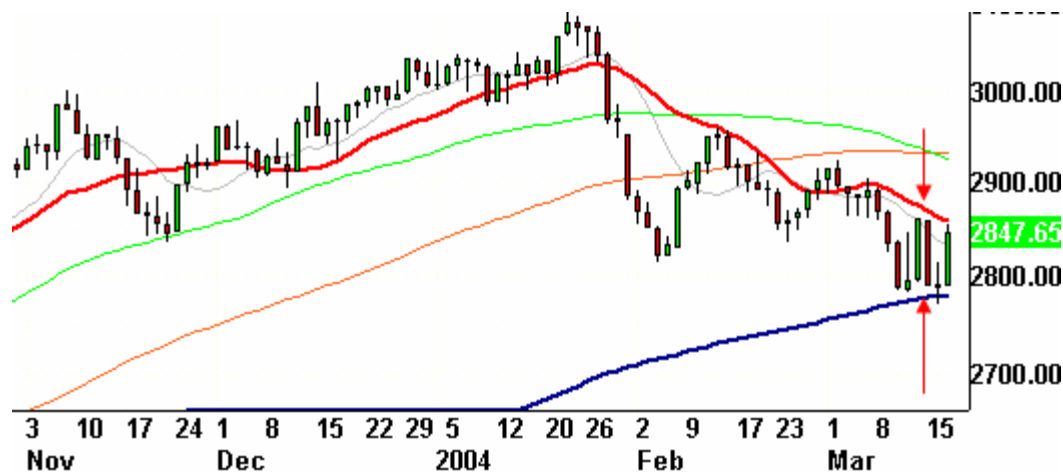
Transport Index Tageschart

----- Der Transport-Index zeigt auf dem folgenden Chart, dass der Preis gegenwärtig zwischen dem 20- und 200-Tages-Index „eingeklemmt“ ist. Aus dieser Situation wird sich der Index in der nächsten Zeit mit einer wahrscheinlich größeren Bewegung zu befreien versuchen. Die wahrscheinliche Richtung ist nach oben. Allerdings könnte dieser Überwindungsversuch noch einige Tage dauern. Bis zum Verfalltag stehen wahrscheinlich ruhigere Tage an.