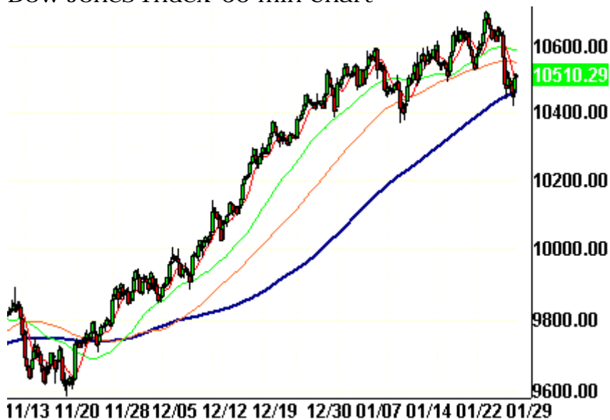
Dow Jones Index-60 min Chart

Die Widerstände nach oben hin sind jedoch beträchtlich. Sie verlaufen bei 10.550 und dann bei 10.580 Punkten. Vorstellbar ist, dass der Dow zunächst in einer engen Range pendelt, bevor er sich für einen Ausbruch in die eine oder andere Richtung entscheidet. Dabei kann der 6.2. (kommender Freitag; Zeitprojektionstag) eine wichtige Rolle spielen.