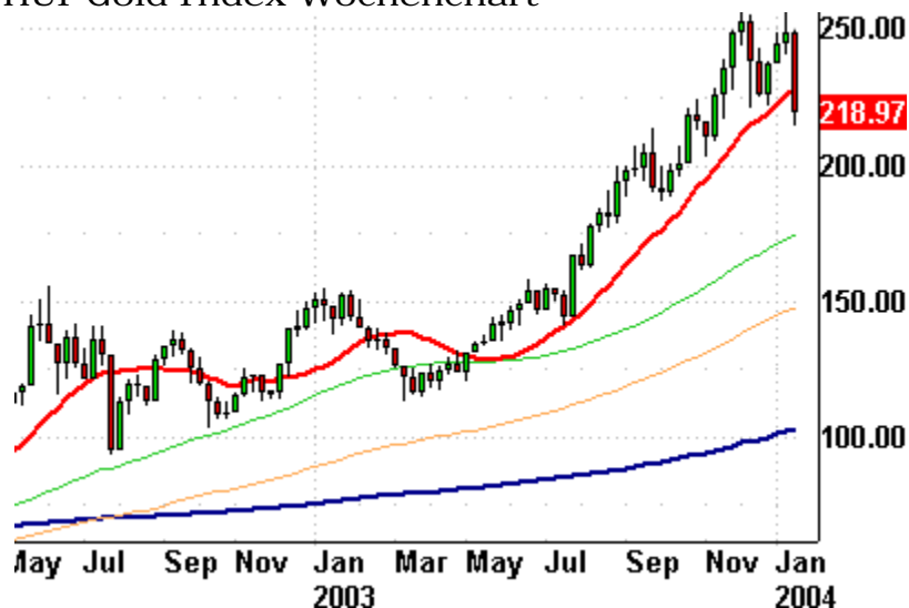
HUI Gold Index Wochenchart

Falls der HUI heute den Sprung zurück über die rote Linie schafft, hat er eine gute Chance, auch in den kommenden drei bis vier Wochen zu steigen. Unter saisonalen Gesichtspunkten erreicht Gold normalerweise seine Höchstkurse Mitte Februar und korrigiert bis Mai. Sollte der HUI dagegen heute unterhalb des Bereichs von 222-224 Punkten enden, so erscheint die Implikation bärisch. Ein „Abtauchen“ bereits zu diesem frühen Zeitpunkt wäre eher ungewöhnlich.