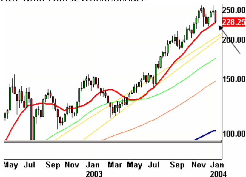
HUI Gold Index Wochenchart

Gold- und Silber-Aktien korrigierten in Antizipation eines Dollar-Anstiegs erneut stark. Auf den Wochencharts können die Goldindizes HUI und XAU derzeit eine Unterstützung aufweisen (die rote 15-Wochen-Linie auf dem folgenden Chart). Zudem befindet sich das 23,2-Fibo-Retracement des Anstiegs seit März bei 224,70 Punkten. Insofern ist zu erwarten, dass die Korrektur zunächst einmal ihr – vorläufiges – Ende gefunden hat.