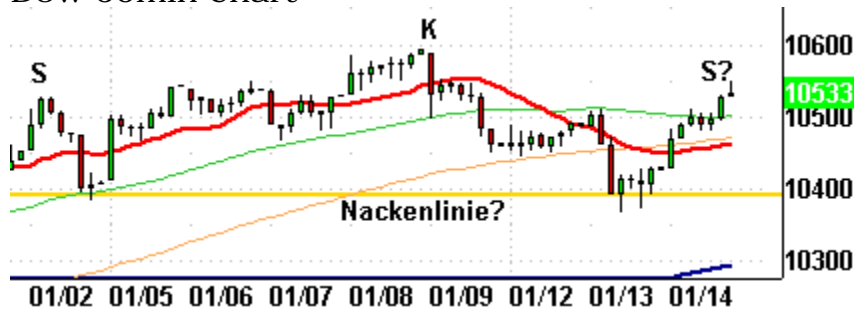
Dow 60min Chart

Das 60min Chart zeigt aber noch etwas anderes. Es ist eine mögliche Schulter-Kopf-Schulter-Formation. Die potentielle Nackenziele ist in gelb bei einem Niveau von 10.400 Punkten eingezeichnet. Für den Fall, dass der 8.1. ein bedeutendes Hoch war, würde die SKS-Formation zur Geltung kommen. Ziel wäre zunächst das 38,2%-Retracement der Dow-Jones-Rallye seit Ende November. Es befindet sich bei gut 10.200 Punkten. Steigt der Dow auf Schlusskursbasis über das heutige Niveau hinaus an, braucht man sich über die potentielle SKS keine Gedanken mehr zu machen.