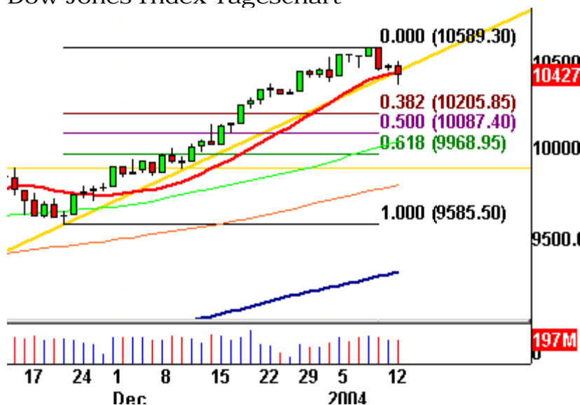
Dow Jones Index Tageschart

----- Wenn man annimmt, das die großen Indizes ihre Korrektur in den nächsten Tagen fortsetzen: Wohin werden sich die Kurse voraussichtlich bewegen? Erfahrungsgemäß verliert der Markt einen bestimmten Prozentsatz seines Anstiegs. Bedeutend erscheinen das 38,2%, das 50% und das 61,8% - Retracement. Das 38,2%-Retracement der Dow-Jones-Rallye seit Ende November befindet sich bei gut 10.200 Punkten. Unterstützung erhält der Dow derzeit durch seinen 15-Tages-Durchschnitt (rote Linie).