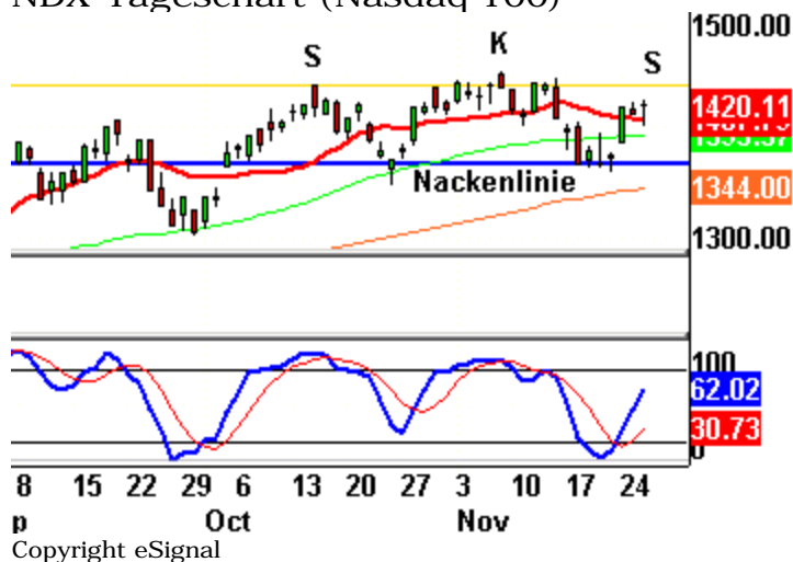
NDX-Tageschart (Nasdaq 100)