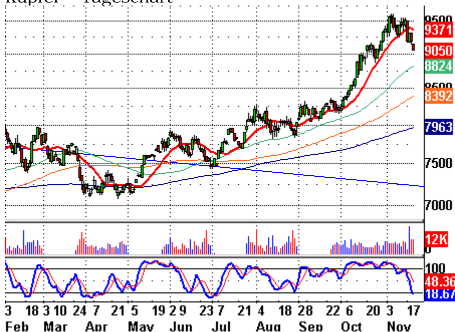
Kupfer – Tageschart

----- Kupfer scheint auf seinem Tageschart so etwas wie ein Doppel-Topp ausgebildet zu haben. Damit scheint der „Bull-Run“ seit Mai zunächst gestoppt. Ein Zusammenhang mit den nicht mehr ganz so rosigen Wachstumsaussichten in China kann nicht ausgeschlossen werden.