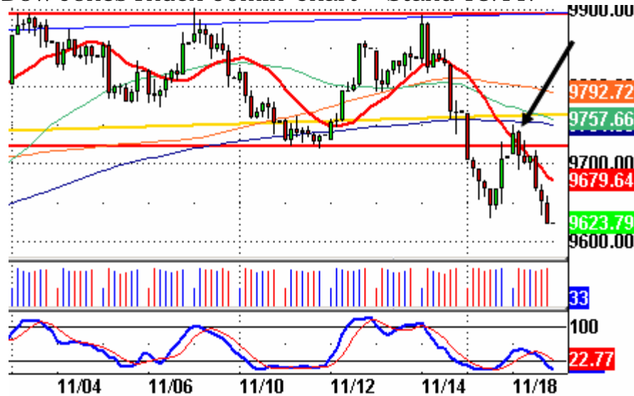
Dow Jones Index 60min-Chart – Stand 18.11.