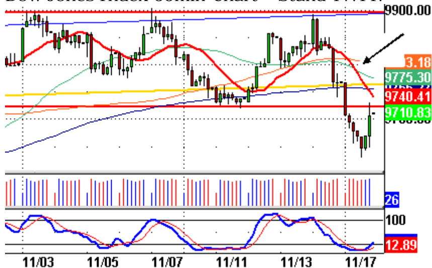
Dow Jones Index 60min-Chart – Stand 17.11.

Das Tageshoch war tatsächlich bei 9750 Punkten; der Einstieg in den Trade hat funktioniert (siehe unten). Das ist natürlich nicht immer so, aber die Wahrscheinlichkeit, dass es klappt, ist doch relativ hoch. Je steiler die Linie, desto schwieriger das Durchkommen. Das 60min Chart ist aus meiner Sicht ein gutes Vehikel, in einen zumindest mittelfristig angelegten Trade mit einem kleinen Stopp hinein zu kommen. Das Tageschart ist dafür oft zu unpräzise.