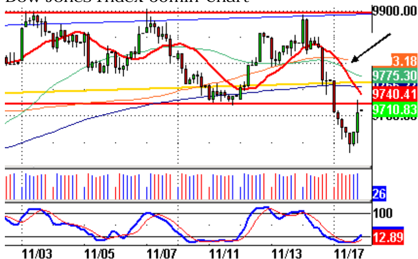
Dow Jones Index 60min-Chart

Die rote Linie befindet sich aktuell bei 9740 Punkten verläuft steil abwärts. Je steiler eine solche Linie, desto unüberwindbarer ist sie normalerweise. Ein Einstieg mit relativ geringem Risiko wäre an der roten Linie möglich. Der Dow dürfte auf 9740 bis max. 9760 steigen, bevor er nach unten abprallen dürfte.