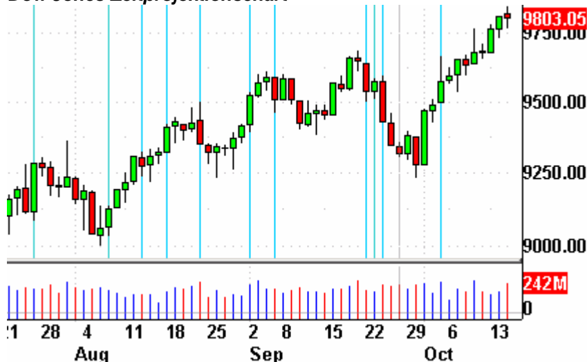
Dow Jones Zeitprojektionschart

Die Indikatoren? Der Volatilitätsindex (VXO) stieg um 0,3% auf 19,39 Punkte. Der VXN verlor 1% und endete bei 26,49 Punkten. Das Put/Call-Verhältnis endete bei 0,67 Punkten. Der bullische Prozentsatz des Nasdaq 100 schloß bei 79%. Der McClellan Oszillator endete bei plus 12,87 Punkten.