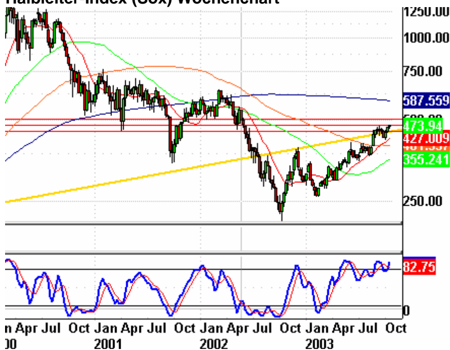
Halbleiter-Index (Sox) Wochenchart

Auffälligkeiten bei der Topp-/Bodenbildung im Dow: Topps formten sich in diesem Jahr oft in der Mitte des Monats: Markant der 21. März, der 17. Juni sowie der 19. September. Diese Daten befinden sich in der Nähe des Beginns neuer Jahreszeiten. Böden kamen häufig zum Monatsende zustande: 31. März, 30. Juni, 30. September. Faszinierend, wie rhythmisch der Markt dieses Jahr verläuft. -----