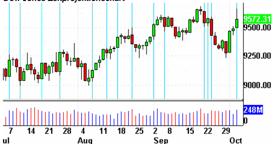
Dow Jones Zeitprojektionschart

Die Indikatoren? Der Volatilitätsindex (VIX) fiel um 6,3% auf 19,50 Punkte. Der VXN verlor 6,6% und endete bei 29,20 Punkten. Das Put/Call-Verhältnis endete bei 0,75 Punkten. Der bullische Prozentsatz des Nasdaq 100 schloß bei 72%. Der McClellan Oszillator endete bei plus 24,78 Punkten.