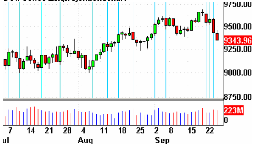
Dow Jones Zeitprojektionschart

Die Indikatoren? Der Volatilitätsindex (VIX) stieg um 4,9% auf 22,26 Punkte. Der VXN gewann 4,4% und endete bei 30,65 Punkten. Da ist noch viel Luft nach oben. Das Put/Call-Verhältnis endete bei 0,86 Punkten. Der bullische Prozentsatz des Nasdaq 100 schloß bei 79%. Der McClellan Oszillator endete bei minus 34,48 Punkten.