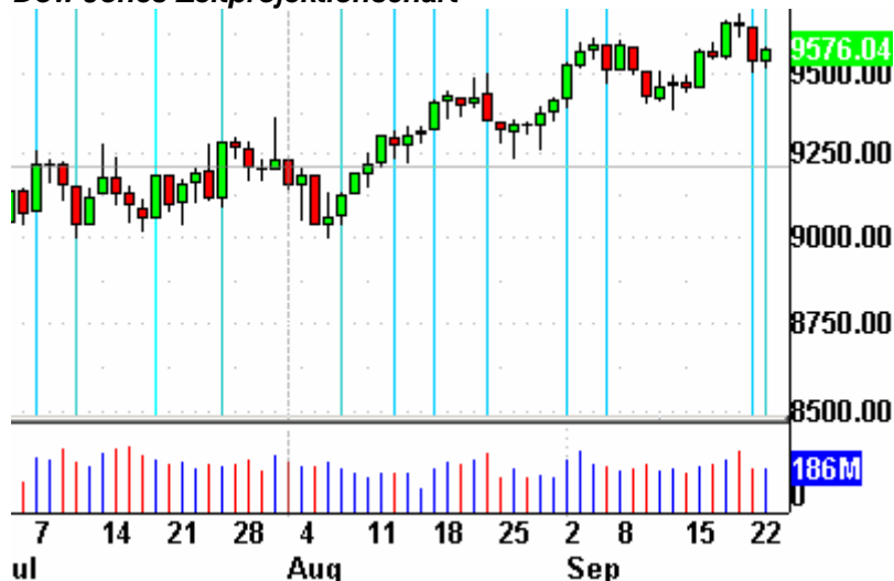
Dow Jones Zeitprojektionschart

Die Indikatoren? Der Volatilitätsindex (VIX) fiel um 1% auf 19,46 Punkte. Das Put/Call-Verhältnis endete bei 0,85 Punkten. Der bullische Prozentsatz des Nasdaq 100 schloß bei 81%. Der McClellan Oszillator endete bei plus 9,37 Punkten.