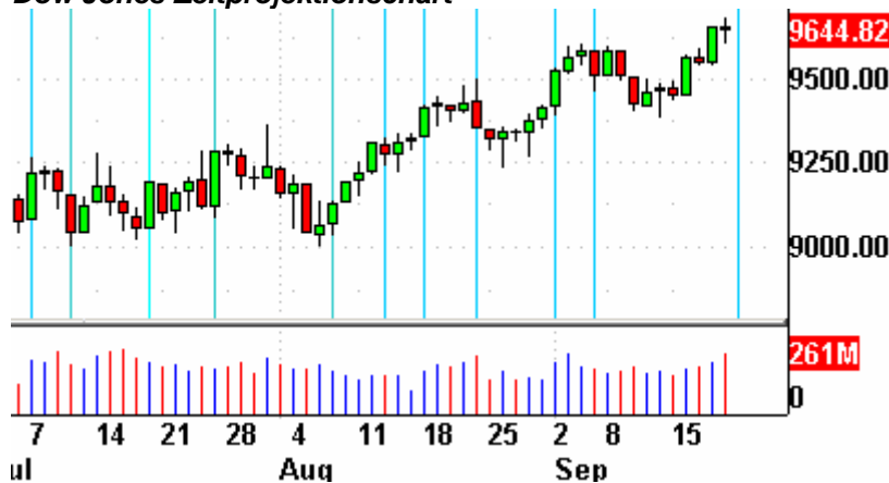
Dow Jones Zeitprojektionschart

Die Indikatoren? Der Volatilitätsindex (VIX) fiel um 1,2% auf 19,07 Punkte. Der VXN fiel um 0,1% auf 29,74 Zähler. Das Put/Call-Verhältnis endete bei 0,68 Punkten. Der bullische Prozentsatz des Nasdaq 100 schloß bei 80%. Der McClellan Oszillator endete bei plus 23,81 Punkten.