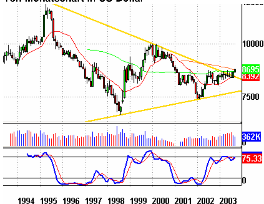
Yen-Monatschart in US-Dollar

----- Das nachfolgende Yen-Monatschart beschreibt eine langfristige Verhaltensänderung im Währungsbereich. Es weist darauf hin, dass der US-Dollar zukünftig gegenüber dem Yen Schwäche zeigen wird. Das vagabundierende Kapital fliesst nach Asien.