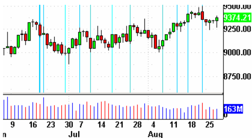
Dow Jones Zeitprojektionschart

Die Indikatoren? Der Volatilitätsindex (VIX) stieg um 0,1% auf 20,34 Punkte. Der VXN stieg um 1% auf 30,05 Zähler. Das Put/Call-Verhältnis endete bei 0,61 Punkten. Der bullische Prozentsatz des Nasdaq 100 schloß bei 74%. Der McClellan Oszillator endete bei plus 32,79 Punkten.