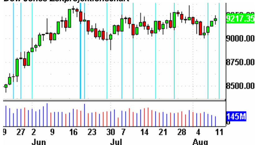
Dow Jones Zeitprojektionschart

Die Indikatoren? Der Volatilitätsindex (VIX) stieg um 0,6% auf 21,42 Punkte. Der VXN stieg um 0,3% auf 32,12 Zähler. Das Put/Call-Verhältnis endete bei 0,65 Punkten. Der bullische Prozentsatz des Nasdaq 100 schloß bei 64%. Der McClellan Oszillator endete bei minus 11,61 Punkten.