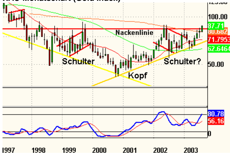
XAU-Monatschart (Gold Index)

Eines meiner Lieblingscharts ist das XAU-Monatschart. Ein Monatsschluß oberhalb von 85 Punkten hat die Vollendung der inversen SKS-Formation zur Folge. Ziel wären 125 Punkte.