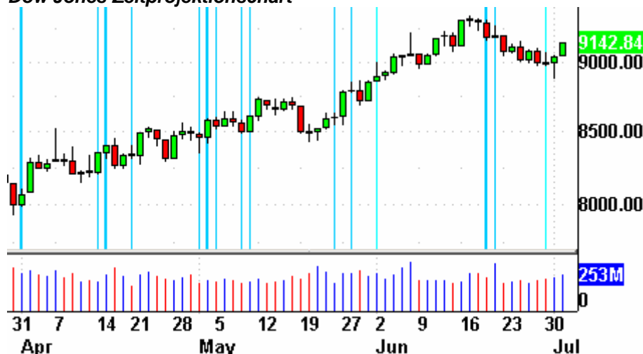
Dow Jones Zeitprojektionschart

Die Indikatoren? Der Volatilitätsindex (VIX) fiel um 1,5% auf 21,29 Punkte. Der VXN fiel um 3,2% auf 30,22 Zähler. Das Put/Call-Verhältnis endete bei 0,77 Punkten. Der bullische Prozentsatz des Nasdaq 100 schloß bei 76%. Der McClellan Oszillator endete bei minus 3,87 Punkten.