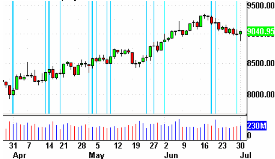
Dow Jones Zeitprojektionschart

Die Indikatoren? Der Volatilitätsindex (VIX) fiel um 1,5% auf 21,29 Punkte. Der VXN fiel um 3,2% auf 30,22 Zähler. Das Put/Call-Verhältnis endete bei 0,95 Punkten. Der bullische Prozentsatz des Nasdaq 100 schloß bei 74%. Der McClellan Oszillator endete bei minus 29,83 Punkten.