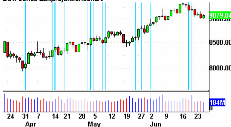
Dow Jones Zeitprojektionschart

Die Indikatoren? Der Volatilitätsindex (VIX) fiel um 6% auf 21,80 Punkte. Der VXN fiel um 2,6% auf 30,91 Zähler. Das Put/Call-Verhältnis endete bei 0,89 Punkten. Der bullische Prozentsatz des Nasdaq 100 schloß bei 76%. Der McClellan Oszillator endete bei minus 39,92 Punkten.