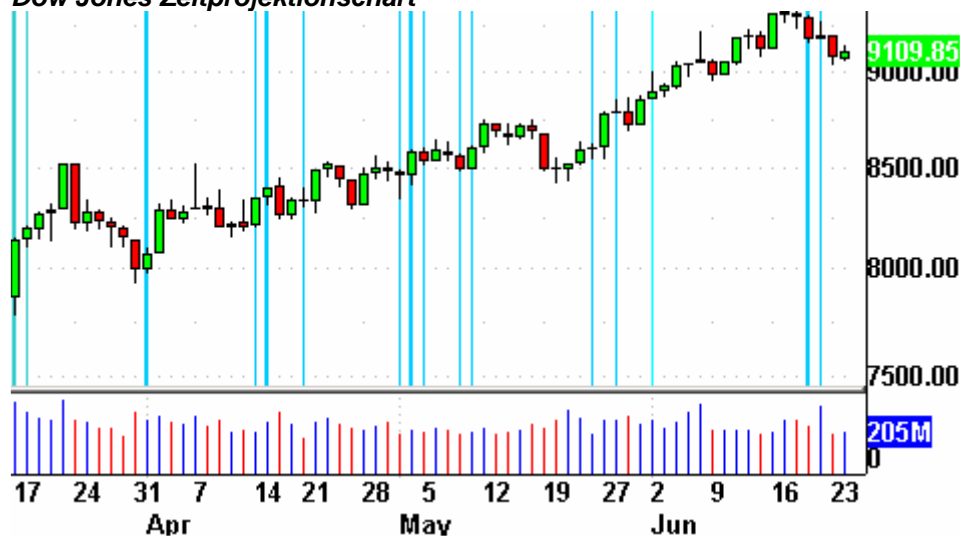
Zeitprojektionstag 30. Juni Dow Jones Zeitprojektionschart

Der Gold Bugs Index HUI fiel um 1,7% auf 145,87 Punkte. Der Gold/Silber Index XAU verlor 2,2%; er endete bei 76,39 Punkten. Newmont Mining verlor 95 Cents und endete bei 31,81 Dollar. Wieder heftige Verluste.