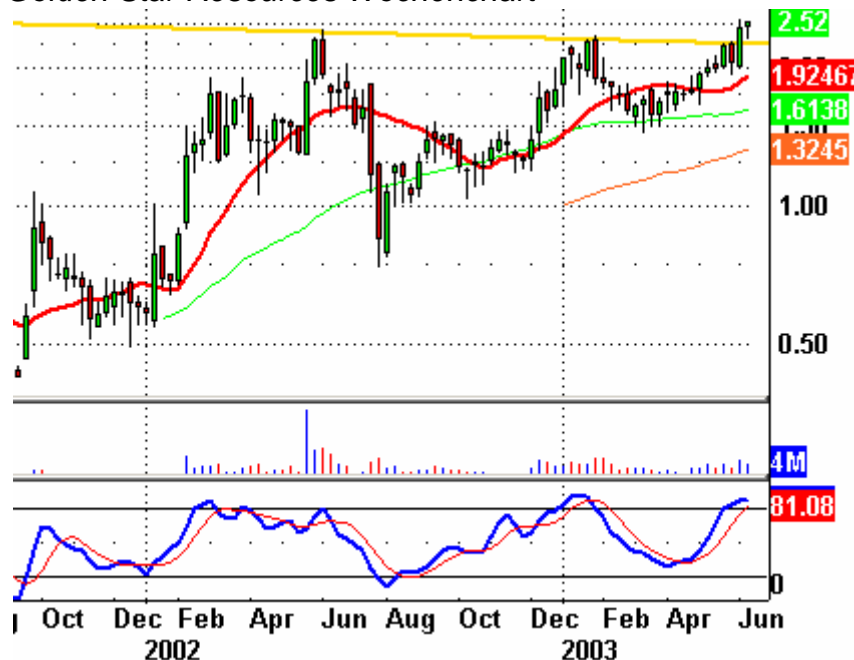
Golden Star Resources Wochenchart

----- Die Gold-Aktien bewegen sich im Aufwärtstrend. Ein Beispiel für eine starke Gold-Junior-Aktie ist Golden Star Resources. Auf dem Chart ist zu erkennen, dass die Mine in der vergangenen Woche aus einem aufsteigenden Dreieck ausgebrochen ist und neue Höhen erklimmt.