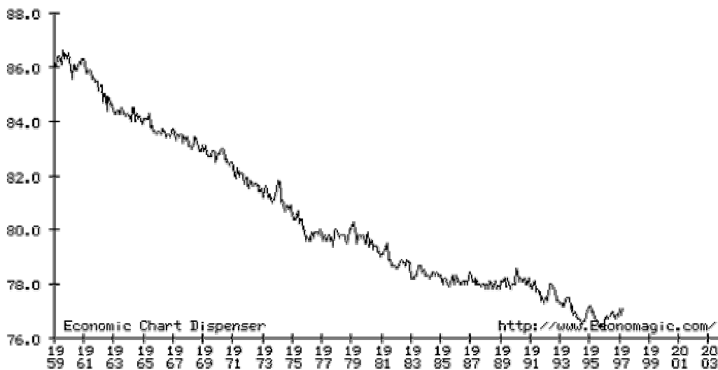
a0m451 Labor force participation rate, males 20 and over (pct.)

Vielleicht geht die Welt in das Equilibrium eines Matriarchats ohne Kriege über. Eine Vision, die zugegebenermassen angenehmer ist als der Gedanke an männlich forcierte oligopolistische Machtstrukturen a la Bush oder auch Marx' Kommunismus.