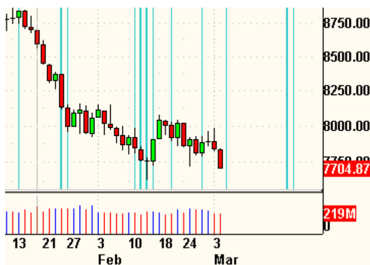
Dow Jones Zeitprojektionschart

Die Indikatoren? Der Volatilitätsindex (VIX) stieg um 7,3% auf 36,58 Punkte. Der VXN stieg um 1,9% auf 44,97 Zähler. Besorgnis im S&P, Unbekümmertheit im Nasdaq. Das Put/Call-Verhältnis endete bei 0,90 Punkten – noch neutral. Der