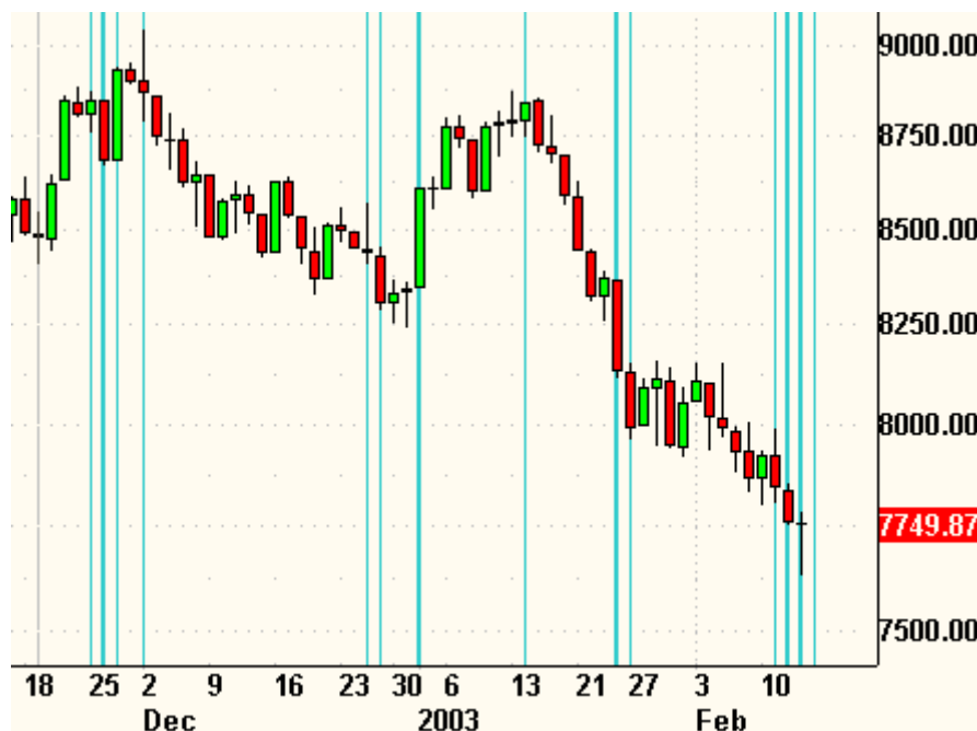
Zeitprojektionschart Dow Jones Index