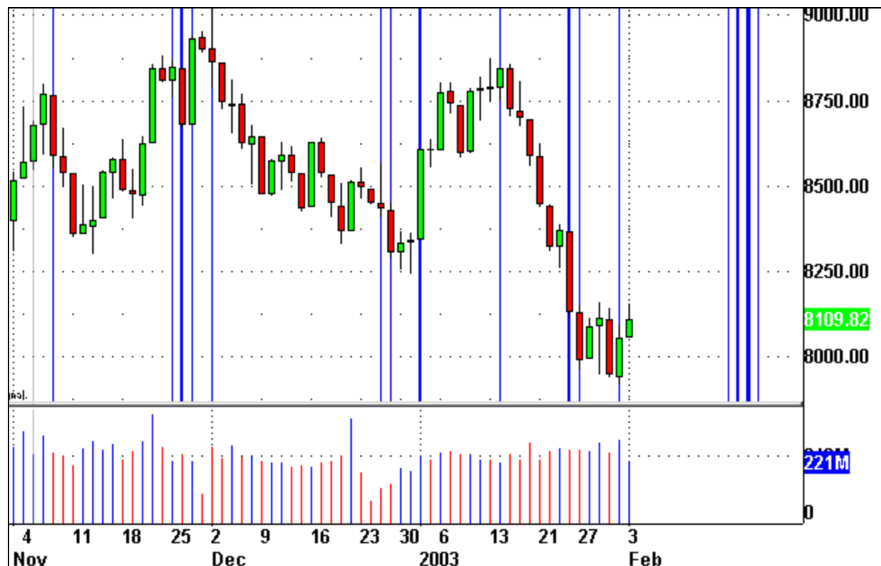
Zeitprojektionschart Dow Jones Index