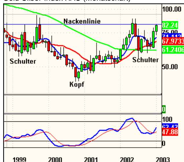
Gold-Silber-Index XAU (Monatschart)

Der XAU scheint einen 5-jährigen Boden in Gestalt einer SKS-Formation auszubilden. Der Durchbruch durch die Nackenziegel kann jederzeit erfolgen. Die Unterstützung durch die 50 Monats-Linie (grün) ist deutlich erkennbar.